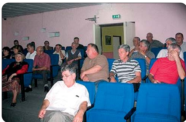
Sastanak u MZ Odžak II

Na sastancima su predočeni ciljevi projekta kao i svrha organizovanja sastanaka sa zahtjevima da se delegiraju prioritetni problemi sa kojima se stanovnici susreću. Na osnovu toga bit će sačinjene liste prioriteta koji će biti polazni osnov LAG-ovima da pristupe izradi akcionih planova. Sačinjeni akcioni planovi putem kampanja zagovaranja predočeni su lokalnoj vlasti.